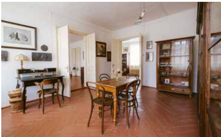
Muzeum Orovara Březiny