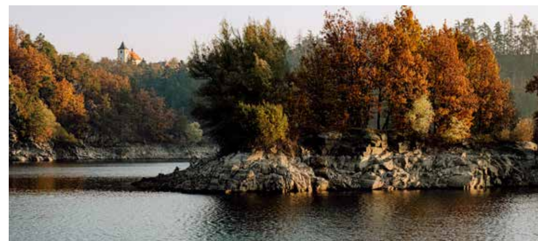
Dalešická přehrada - Hartvíkovic

v 70. letech minulého století hráz Dalešické přehrady. Na její hladinu vyplouvá celoročně výletní loď Horácko, v září a říjnu o víkendech a svátcích třikrát denně. Během plavby uvidíte skalní útvary jako je vztyčený prst, žabák, několik ostrůvků a také hradisko Kramolín. Objeďte okolí přehrady na kole nebo pěšky. Síť cyklotras a pěších stezek vás provede po obou březích přehrady. Výhled na přehradu se vám otevře z vyhlídky u Kozlan, Stropešína nebo Hartvíkovic.