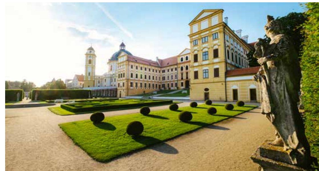
Zámek Jaroměřice nad Rokytnou