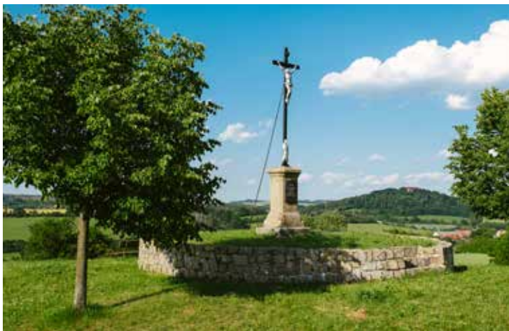
Hanzalův kopeček u Čáslavic

Severně od Třebíče se rozprostírá typická krajina této části Vysočiny tvořená balvanitými ostrůvky s lesíky a křovinami. Rozmanité tvary balvanů a skalisek daly průchod lidské představivosti a vznikla řada pověstí. Své putování zahajte nejlépe na nádraží v Rudíkově. Blízký les ukrývá Raubířské skály, ve kterých se podle pověsti ukrývali loupeživí chlapci. Říkalo se jim raubčíci. Okolí Kamenné u Budišova si oblíbil čert, nechal zde otisk své ruky a na kameni, odkud se rozhlížel do kraje, nechal vysezený důlek. Jiné kameny ve tvaru mís daly vzniknout pověstem o pohanských obětích. Kámen se ve vesnici těží dodnes a pod šikovníma rukama místního umělce vzniklo spojení kamene se železem. Nad vesničkou stojí krásná zvonička,