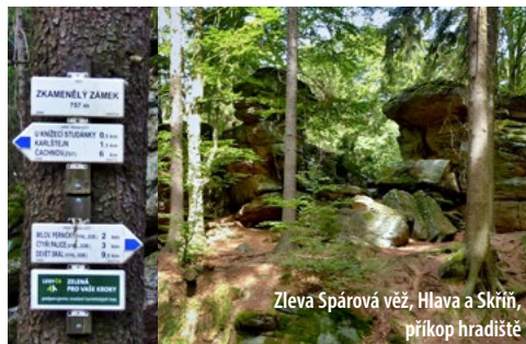
Zleva Spárová věž, Hlava a Skříň, příkop hradiště

Skalní útvar u loveckého záměčku Karlštejn pod stejnojmenným vrchem se jmenuje Zkamenělý zámek. Skupinu skal na hřebetu Žďárských vrchů najdete u m. č. Česká Cikánka.